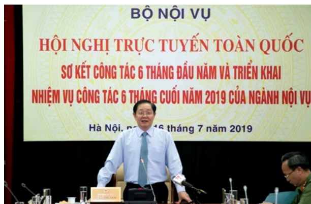
Bộ trưởng Lê Vĩnh Tân phát biểu kết luận Hội nghị