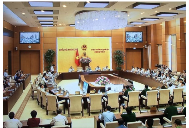
Ủy ban Thường vụ Quốc hội khai mạc Phiên họp thứ 35.

Phiên họp thứ 35 của Ủy ban Thường vụ Quốc hội khai mạc sáng nay (15/7) dưới sự chủ trì của Chủ tịch Quốc hội Nguyễn Thị Kim Ngân.