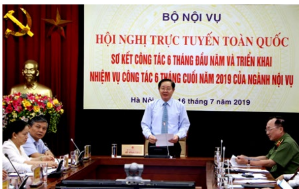
Bộ trưởng Lê Vĩnh Tân phát biểu khai mạc Hội nghị

Tham dự Hội nghị tại điểm cầu Hà Nội có lãnh đạo, đại diện lãnh đạo các Vụ (Ban) Tổ chức cán bộ của Văn phòng Trung ương Đảng, Ban Tổ chức Trung ương, Ủy ban Kiểm tra Trung ương, Ban Dân vận Trung ương, Văn phòng Quốc hội, của các bộ, cơ quan ngang bộ, cơ quan thuộc Chính phủ; các đồng chí Thứ trưởng; Bí thư Đảng ủy, Chủ tịch Công đoàn, Chủ tịch Hội Cựu chiến binh, Bí thư Đoàn Thanh niên Bộ; Thủ trưởng các đơn vị thuộc, trực thuộc Bộ Nội vụ.