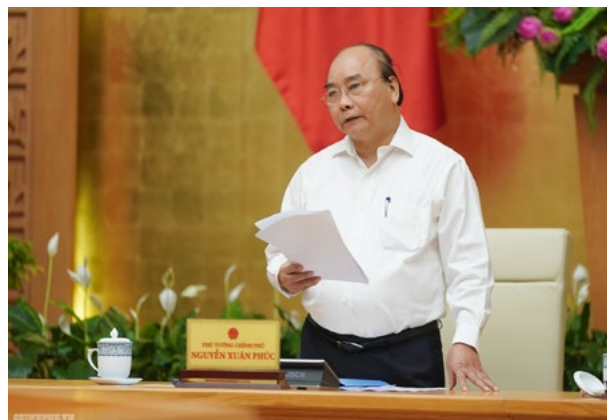
Thủ tướng Nguyễn Xuân Phúc phát biểu tại buổi làm việc.

Thủ tướng nêu rõ, trong kinh tế thị trường, thời cơ là quan trọng, do đó, Ủy ban cần trả lời nhanh, quyết đáp nhanh những vấn đề tập đoàn, tổng công ty xin ý kiến.