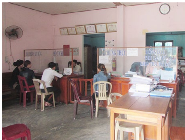
Bộ phận một cửa ở 1 xã của huyện Núi Thành.

Xếp hạng thứ 9 trong tổng số 18 huyện, thị xã, thành phố của Quảng Nam về chỉ số cải cách hành chính (CCHC) năm 2018, huyện Núi Thành đã và đang khắc phục những hạn chế, đẩy mạnh công tác CCHC để cải thiện vị thứ.