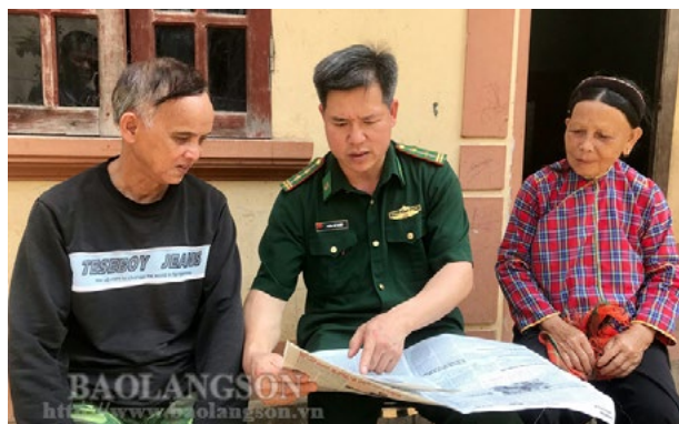
Cán bộ Đồn Biên phòng Thanh Lòa (Cao Lộc) đọc chuyên mục cải cách TTHC trên Báo Lạng Sơn cho người dân nghe

(TTHC) tại Lạng Sơn mang lại những kết quả tích cực, tạo bước chuyển trong việc nâng cao nhận thức của người dân, doanh nghiệp và cán bộ, công chức, viên chức trong việc chung tay đẩy mạnh cải cách TTHC.