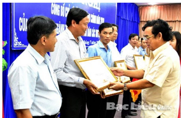
Chủ tịch UBND tỉnh Dương Thành Trung trao bằng khen cho các tập thể có thành tích xuất sắc trong công tác CCHC năm 2018.

hạng 34, tăng 18 bậc so với năm 2017 về chỉ số công tác chỉ đạo điều hành CCHC. Đây là kết quả tất yếu của việc tỉnh ban hành kịp thời, chất lượng kế hoạch CCHC; phần lớn các báo cáo định kỳ đầy đủ nội dung được gửi theo đúng thời gian quy định; công tác kiểm tra CCHC hoàn thành chỉ tiêu kế hoạch đề ra; công tác tuyên truyền được thực hiện thường xuyên bằng nhiều hình thức phong phú, đa dạng.