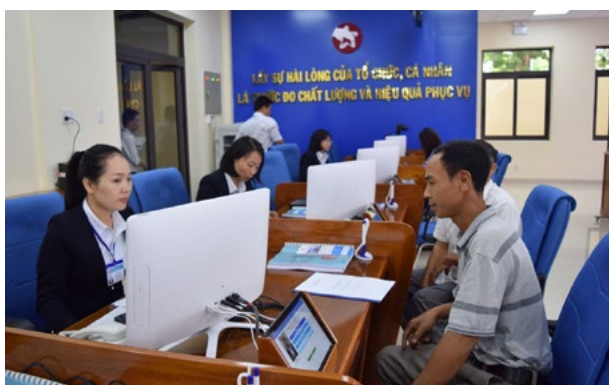
Nhân dân nộp hồ sơ giải quyết TTHC tại Trung tâm ngay sau lễ khai trương

Trung tâm Phục vụ hành chính công tỉnh Kon Tum là đầu mối một cửa cấp tỉnh tập trung, thực hiện liên kết việc tiếp nhận hồ sơ, trả kết quả giải quyết 1.170/1.402 thủ tục hành chính (TTHC) thuộc thẩm quyền của các cơ quan cấp tỉnh và một số thủ tục của Công an tỉnh.